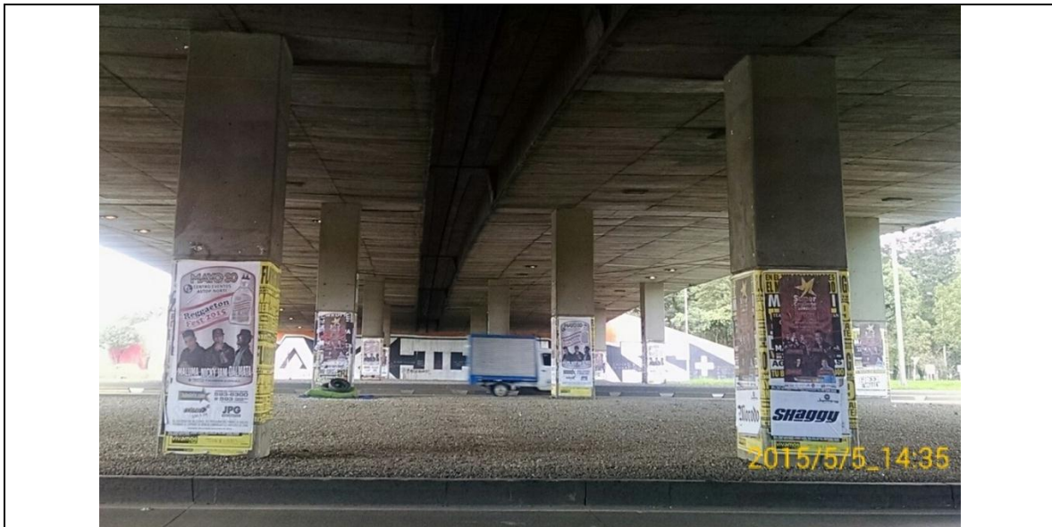
Fotografía No. 1. Elementos instalados en Espacio Público. Evento Reggaeton Fest 2015. Puente Vehicular Avenida Calle 26 con Carrera 50. Mayo 5 de 2015.