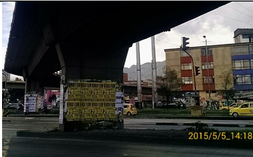
Fotografía No. 1. Elementos instalados en Espacio Público. Evento Ñengo Flow. Puente Vehicular Avenida Carrera 30 No. 33. Mayo 5 de 2015.

Registro fotográfico, Visita de Control efectuada el día 05/05/2015